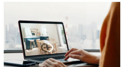
AI×VRで充実した物件検討サポート

お客さまがいつでも住宅検討できる環境を整備し、デジタルコンテンツの拡充で多様・独自情報の提供