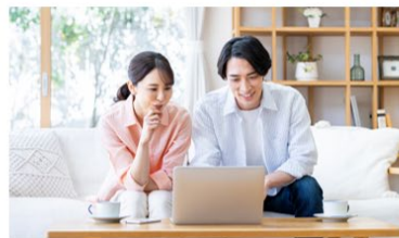
場所を問わない検討環境の整備