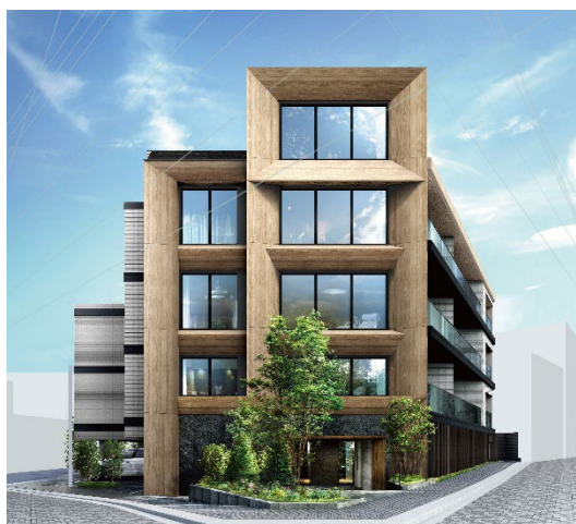
パークホームズ東高円寺 外観完成予想 CG