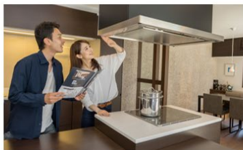
平日・土日祝問わず自由に見学