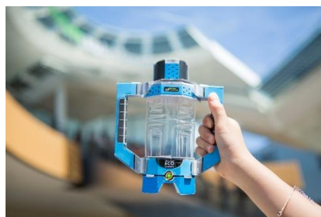
【オリジナル「ソーラーらんたん」イメージ】