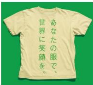
【「&EARTH 教室衣料回収プロジェクト」イメージ】