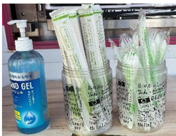
【環境に配慮したカトラリー】