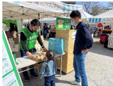
【これまでの&EARTH 衣料回収プロジェクトの様子】