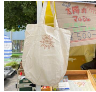
【「不用コスメから作った絵具でマイエコバッグをつくろう」ワークショップイメージ】