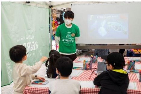
【2023 年 3 月「&EARTH 教室」の様子】

※前回 2023 年 3 月開催時は、各回満員の計 110 名のお子様にご参加いただきました。