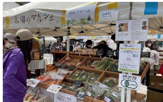
【これまでの「太陽のマルシェ」の様子】