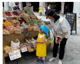
【「キッズマルシェ」の様子】