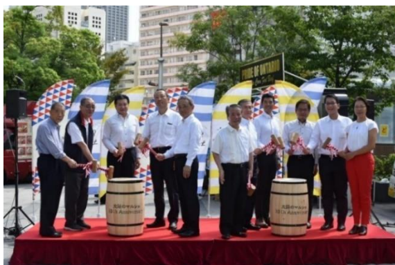
【10周年セレモニーの様子】

地元関係者にご列席いただき、ワイン樽の鏡開きをしました。登壇者の皆様にご挨拶いただき、「太陽のマルシェ」の10周年をお祝しました。