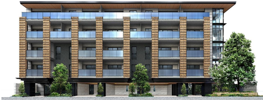
【外観完成イメージ】