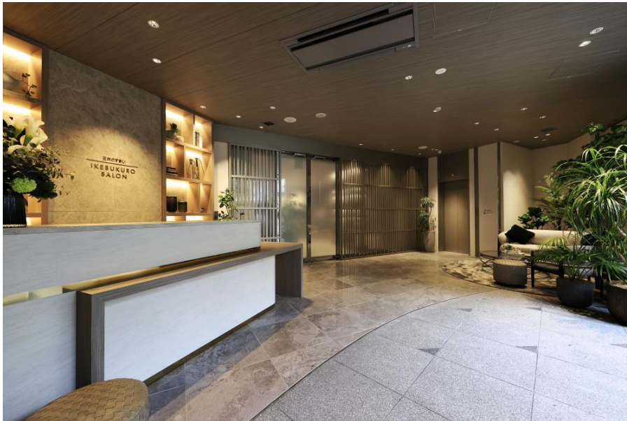
【本サロンエントランス】

今後も、当社の全住宅事業のブランドコンセプトである「Life-styling × 経年優化」のもと、多様化するライフスタイルに応える商品・サービスを提供するとともに、安全・安心で快適にらせる街づくりを推進し、持続可能な社会の実現・SDGsへ貢献してまいります。