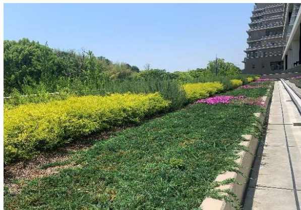
3階バルコニーの多様な低木植栽