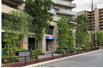
高木・低木を組み合わせた植栽