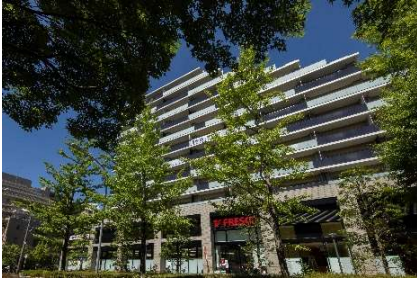
千里中央公園にも隣接する植栽豊かな外構