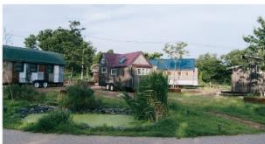
千葉県木更津市 KURKKU FIELDS