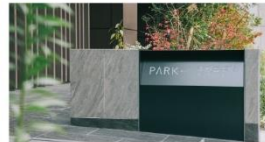
東京都墨田区 PARK AXIS 本所吾妻橋サウスレジデンス