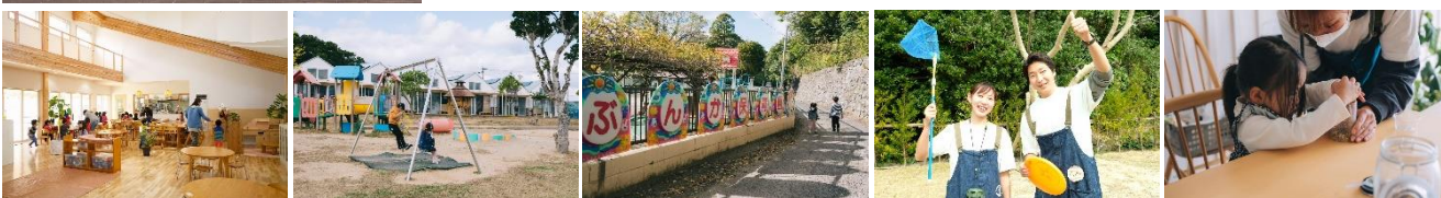
▲ 写真左から：恵プラザこども園、こもれびの舎保育園、文化保育園、滞在中のエクスペリエンスをサポートするカラリトスタッフ、滞在中のエクスペリエンス例