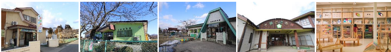
▲ 写真左から：民田保育園、上郷保育園、湯田川保育園、十坂こども園、キッズドームソライ