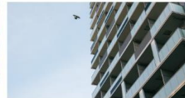
東京都豊島区 PARK AXIS 池袋