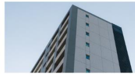
東京都新宿区 PARK AXIS 神楽坂・早稲田通り