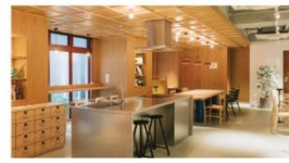
東京都墨田区 PARK AXIS 錦糸町スタイル