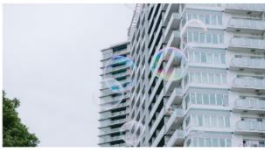
東京都江東区 PARK AXIS 豊洲キャナル