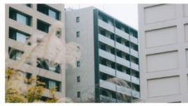
東京都中央区 PARK AXIS 日本橋茅場町