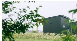
埼玉県加須市 HATASUMIKA / 畑住処