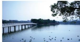
福岡県福岡市 PARK AXIS 六本松