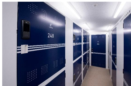
▲収納スペース内観（ロッカータイプ）