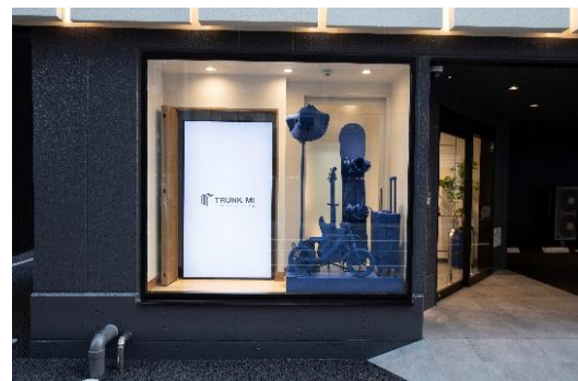
▶エントランスに設置するディスプレイ

外観は、収納スペースの空間をイメージしたキューブによる凹凸模様をデザインし、夜にはそれぞれのキューブに組み込んだ照明が光の格子模様を浮かび上がらせ、街並みに彩りを創出します。エントランスには、大型モニターの映像と実際の荷物を模したオブジェのディスプレイを組み合わせ、「TRUNK Mi」活用のイメージをわかりやすくお伝えします。