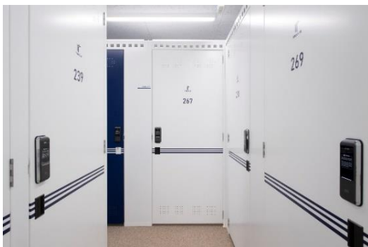
▲収納スペース内観

収納スペースは、お客様の荷物の量やサイズに応じてご利用いただけるよう、0.3畳のコンパクト収納タイプから法人の倉庫としても活用できる8.4畳の大型収納タイプ、0.5畳から0.8畳のロッカータイプの計31種類を取り揃えました。個人・法人問わず、幅広いニーズにお応えします。また荷物の積み下ろしに便利な敷地内駐車場もご用意。さらに、スマートキーの導入により、24時間365日自由に荷物の出し入れが可能です。