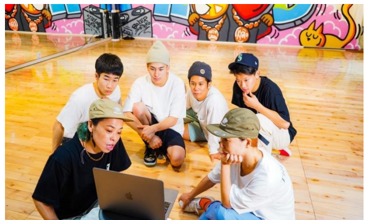
<自分らしさを表現する大切さを伝える講師の様子>