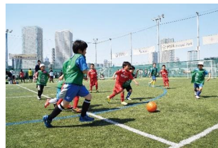
音楽とフットボールによるコミュニケーションの創造 「MIFA Football Park」

「住んでからもお客様に幸せを届ける」をテーマに、マンションというハード面だけではなく、「豊かな時間」「豊かな心」というソフト面も同時に提供する事業を推進します。さらに、SDGsへの貢献活動や新しい事業領域に挑戦し、エリア全体を面で捉え、湾岸エリアの地域活性化を図ってまいります。住民が一体となったコミュニティを形成し、住み続けたい街にするために、「食」「スポーツ」「アート」「教育」「音楽」「環境」などの幅広い分野において、住民が楽しみを体験・共有できる様々な活動を支援する三井不動産レジデンシャルの取り組みです。