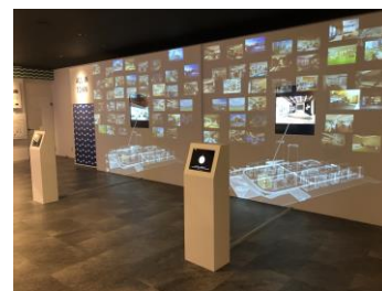
「ALL IN TOWN」コーナー (街にそろう施設と共用スペース)