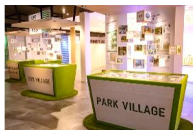
「LIFE IS PARK」コーナー (中庭紹介)