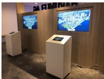
「BORDERLESS」コーナー (ゼロからの一斉開発)

街づくりの仕組みや新たな交通機関「東京BRT」・新しい駅「マルチモビリティステーション」、共用スペースや施設の紹介、中庭空間の見どころなど、5つのコーナーにて街の魅力を分かりやすく解説いたします。