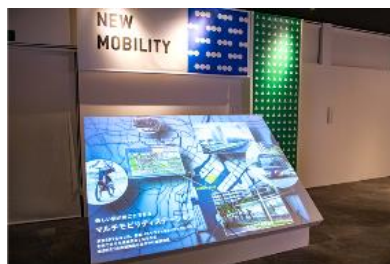
「NEW MOBILITY」コーナー (新たな交通機関「東京BRT」)