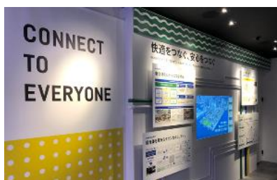
「CONNECT TO EVERYONE」コーナー (街のマネジメント)