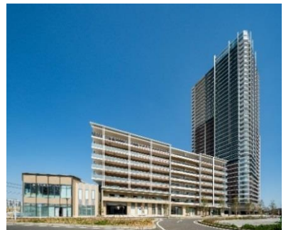
「幕張ベイパーク クロスタワー&レジデンス」 外観写真