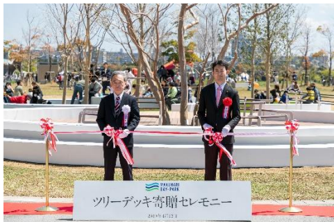
【千葉市長によるツリーデッキ前テープカットセレモニーの様子】

※「第1期街開き」は、10年超に渡る幕張ベイパーク街づくりにおける分譲住宅事業第1弾「幕張ベイパーク クロスタワー&レジデンス」の入居開始、および「イオンスタイル幕張ベイパーク」、「幕張ベイパーク クロスポート」、「TENT 幕張」等の施設のグランドオープンを指しています。