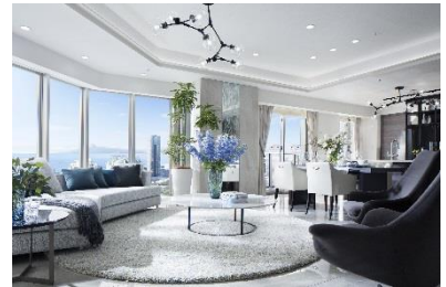
「幕張ベイパーク スカイグランドタワー」 モデルルーム写真①