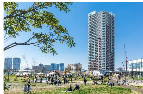
【若葉3丁目公園での交流イベントの様子】

当日は、「幕張ベイパーク」の街づくりに関する概要説明会、若葉3丁目公園内に完成する「ツリーデッキ」の千葉市への寄贈セレモニーのほか、「イオンスタイル幕張ベイパーク」や「幕張ベイパーク クロスポート」、「TENT 幕張」などの新規開業施設の自由見学会、住民による交流イベントが催されました。それらを通し、「幕張ベイパーク」だからこその、公園を中心に街全体を活かしたアクティビティや、様々な施設、機能を集約したミクストユースな暮らし、また“住民が主体となって取り組む”新たなエリアマネジメントにより醸成される街の賑わいを体感いただけたりとなりました。