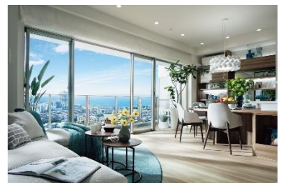
「幕張ベイパーク スカイグランドタワー」 モデルルーム写真②