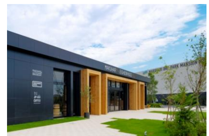
「MAKUHARI NEIGHBORHOOD POD」 外観写真