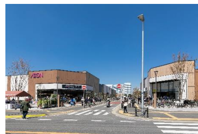
「イオンスタイル幕張ベイパーク」 外観写真