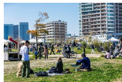
「幕張ベイパーク ピクニック」 開催模様