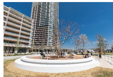
「若葉3丁目公園ツリーデッキ」 完成写真

※「景観形成推進地区」とは「景観計画区域内において、地域の特性を生かし、先導的な景観形成を図る必要がある特定の地区」を指します。2019年1月4日付千葉市告示第3号にて幕張新都心若葉住宅地区が千葉市の景観形成推進地区に指定されました。