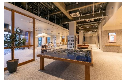
「幕張ベイパーク クロスポート」 内観写真

HP: https://www.b-pam.com/ (一般社団法人幕張ベイパークエリアマネジメントのHPです。)