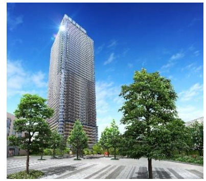
「幕張ベイパーク スカイグランドタワー」 完成予想CG (※)

本施設の取り組みは、より魅力的な景観形成を実現する施設として「千葉市都市文化賞2018(景観まちづくり部門)」を受賞いたしました。