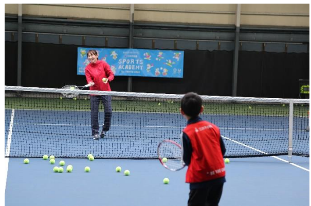
第15回/テニスアカデミー