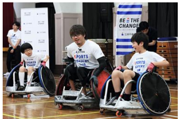
第8回/ウィルチェアラグビーアカデミー