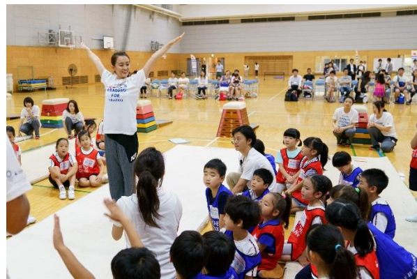
第9回/体操アカデミー