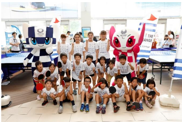
第14回/卓球アカデミー