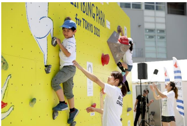
第7回/クライミングアカデミー