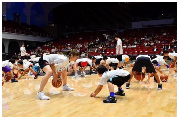
第10回/バスケットボールアカデミー