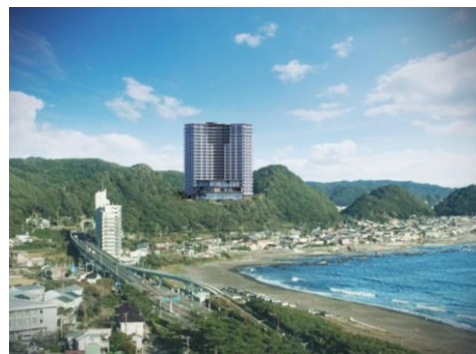
鴨川市内から本計画地方向を望む（建物 CG を合成）