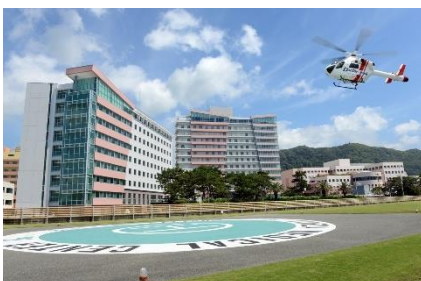
亀田メディカルセンター (※4)