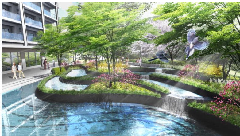
メインガーデン完成イメージ