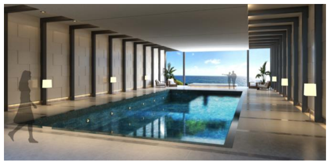
プール完成イメージ