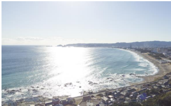
現地からの眺望（本物件 8 階相当の高さより）

本物件は、太平洋を望む標高約 46m の高台に建つ 22 階建のトライスター形状の建物です。約 2/3 の住戸からは、太平洋の大海原や日本の渚百選に選ばれている前原・横渚海岸の海岸線の眺望を愉しむことができ、また約 1/3 の住戸からは山々の美しい緑の眺望を満喫いただけます。さらに、レストラン、大浴場、最上階のラウンジからも、海や山々のダイナミックな眺望をご覧いただくことができます。また建物の足元には約 2,200 m 2 もの広大な中庭を設け、豊富な緑と趣向を凝らした水景がご入居者の憩いの空間を創出します。