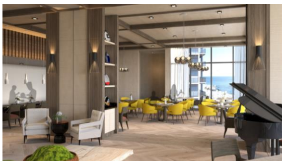
レストラン完成イメージ

本物件には、レストラン（西洋フード・コンパスグループ株式会社に業務委託予定）、プール、大浴場・露天風呂（温泉を予定）をはじめ、多目的ホール、アトリエ、ビリヤード、麻雀ルーム、ピアノ室、ラウンジ、バー、ライブラリーなどの娯楽施設や、ご入居者の憩いの場となるメインガーデンなど、ご入居者のコミュニティを育む共用空間と様々なプログラムやイベントを提供します。