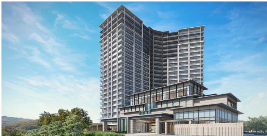
「(仮称)パークウェルステイト鴨川計画」完成予想イメージ

なお、本計画は、2019年6月開業予定の「パークウェルステイト浜田山」に続く、第2号物件となります。