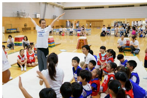
第9回/体操アカデミー