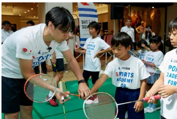
第2回/バドミントンアカデミー