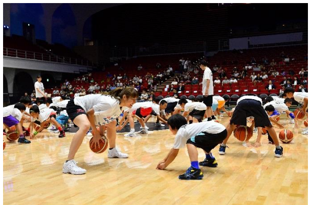
第10回/バスケットボールアカデミー