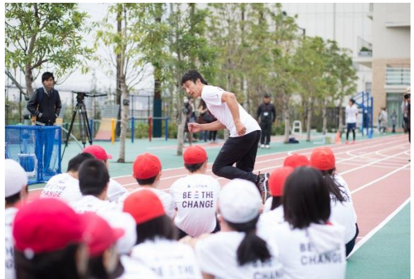
第5回/陸上アカデミー