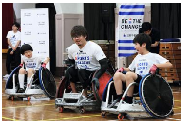
第8回/ウィルチェアラグビーアカデミー