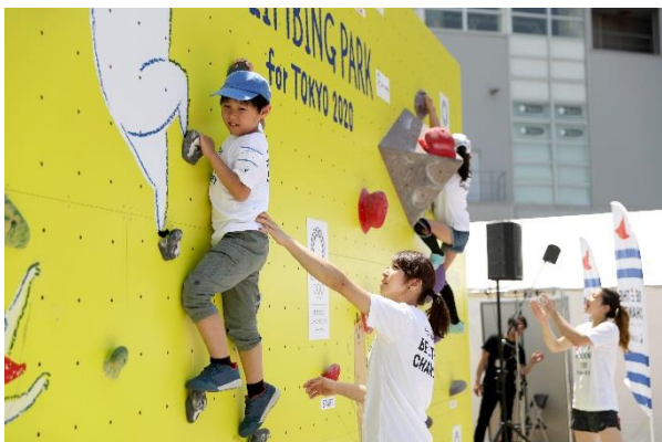
第7回/クライミングアカデミー