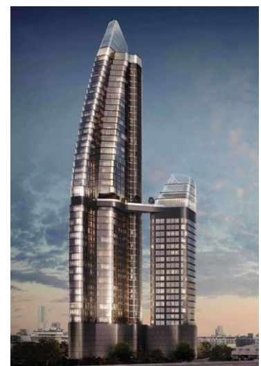
③ Ideo Q Sukhumvit 36 1