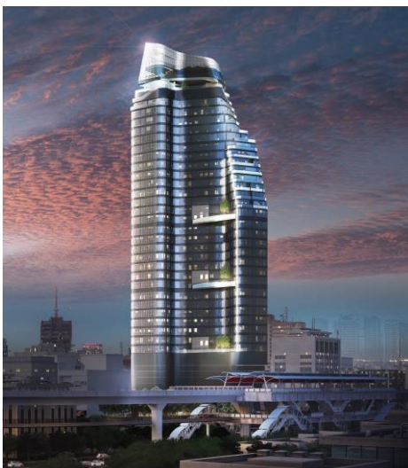
① Ideo Q Victory