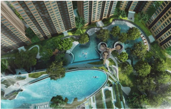
④ Elio Del Nest

日本人をはじめ多くの外国人からの人気が高いトンロー地区に所在。BTS(高架鉄道)「トンロー」駅から徒歩6分。トンロー駅周辺には商業施設、飲食施設等が充実。スカイプールやジムなどの充実した共用施設により、高い居住性能を図ります。