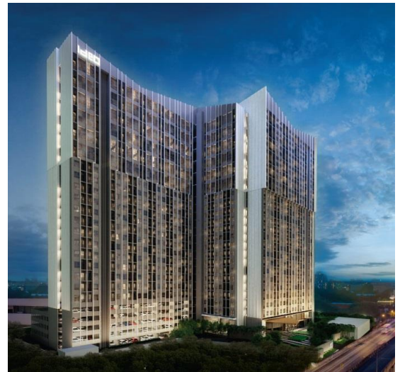
⑤ Ideo New Rama 9