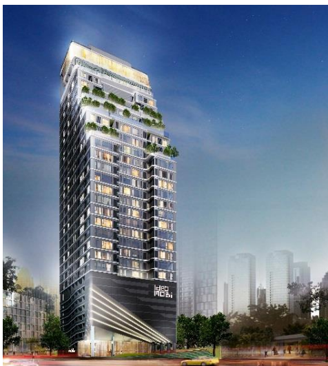
⑥ Ideo Mobi Rangnam

古くから住宅地として発展しているラムカムヘン地区に所在。スワンナプーム国際空港へつながるエアポートリンク「ラムカムヘン」駅から徒歩10分。24時間営業のスーパーや大規模モールが徒歩圏であり、生活利便性が高い。プールやジムなどの充実した共用施設により、高い居住性能を図ります。