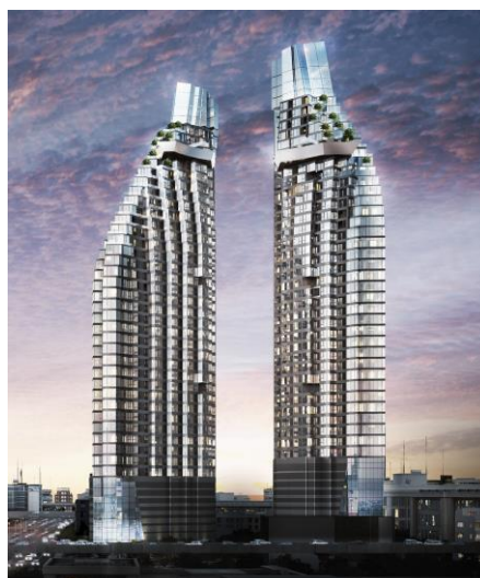
② Ashton Asoke-Rama 9