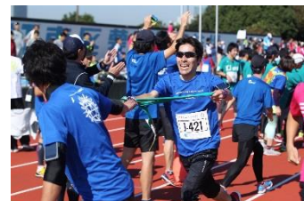
<タスキをつなぐリレーマラソン>