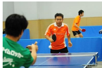
<卓球競技(イメージ画像)>

たくさんのご要望の中から、新競技種目としてチーム対抗の卓球競技を開催することが決定致しました。1チーム4～8名、1得点を取った場合もしくは2得点連続で失点した場合にチームメイトと交代する『ザ・コーポレートゲームズ 東京』独自ルールによって、チーム全員で戦う競技としています。