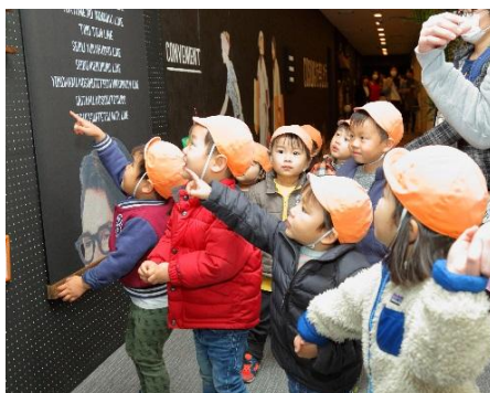
展示された電車の模型に大歓声