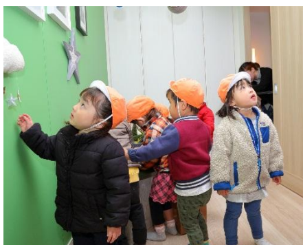
モデルルーム見学