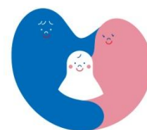
対象物件の目印となるマーク

【関連 URL】 http://www.31sumai.com/promo/mama-smile/