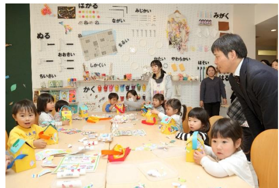
工作（おうちバッグ作り）

毎日のお散歩からちょっと足を伸ばした子どもたち。初めて見るモデルルームに目を輝かせながら、モデルルーム探検がはじまりました。子ども部屋のおもちゃに歓声をあげたり、ベランダから見える風景写真を眺めて室内を回ったあとに、武蔵小杉の街のジオラマがあるスペースへ。週末にパパと行く地元サッカーチームの競技場を見つける子、近所のおじいちゃんのお家を探す子など、空から見る街の光景にあちこちで歓声があがりました。最後は、家をかたどった紙製バッグ（おうちバッグ）作りです。屋根や壁に思い思いのパーツを貼り付け、持ち手を通して完成。お土産となった「運べるお家」を手に、スタッフに見送られながらモデルルームを後にしました。