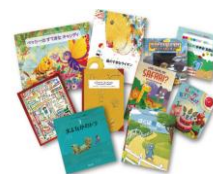
キッズコーナーには世界の絵本を用意