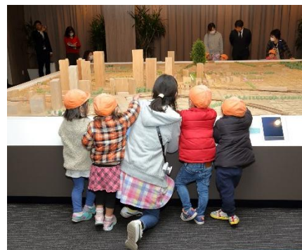
ジオラマ（模型）見学