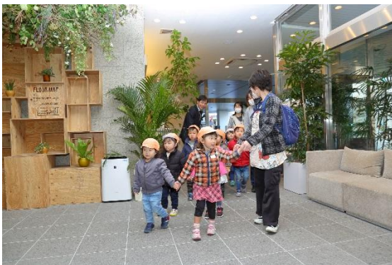
モデルルームへ到着