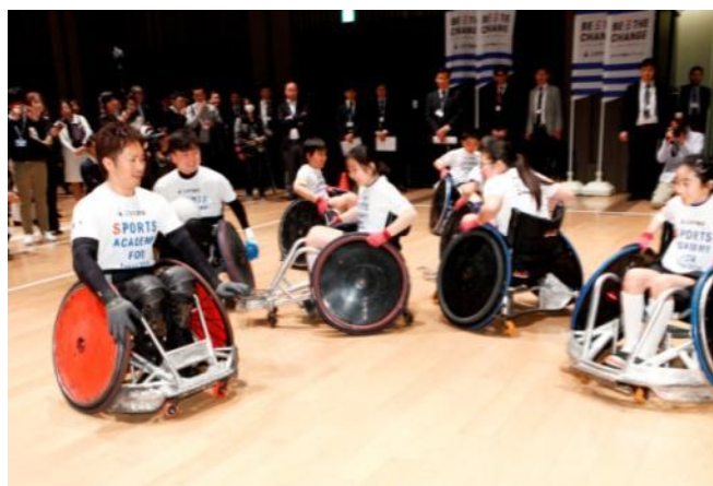
日本代表選手によるウィルチェアラグビーアカデミーの様子