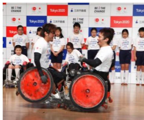
ウィルチェアラグビーのデモンストレーション