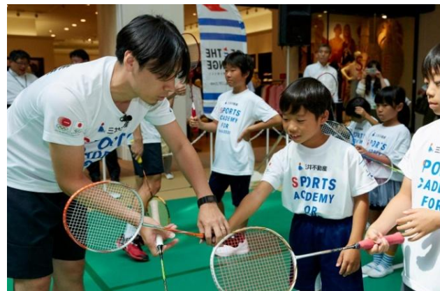
バドミントンアカデミー