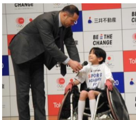
ウィルチェアラグビー体験