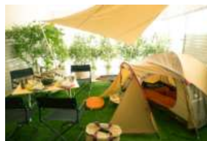
～ステイ スタイル～ イメージ