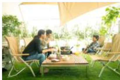
～リビング スタイル～ イメージ