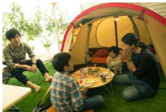
「半ソト空間」での生活イメージ