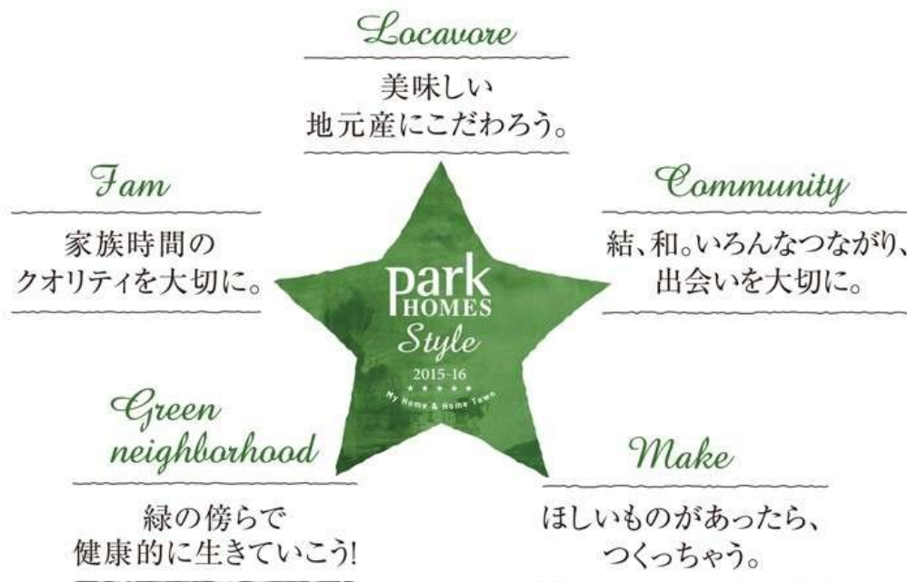
『Park HOMES Style 2015-16』 5つのコンセプト図

■ 『Park HOMES Style 2015-16』公式サイト: http://parkhomesstyle.com