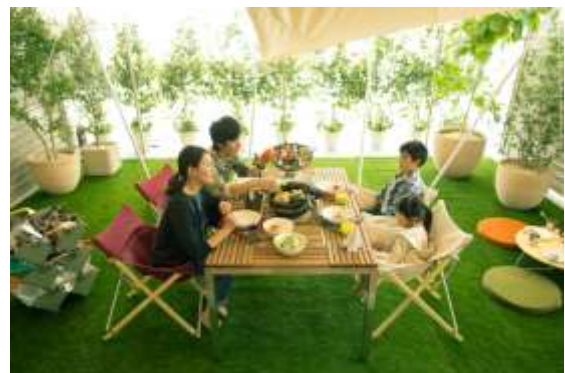
「半ソト空間」イメージ