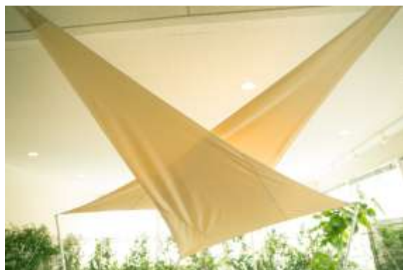
オリジナルトライアングルシェード

これまでも共用部での部分的なアウトドアライフの提案(アウトドア製品の採用等)はありましたが、居住スペースと繋がる専用庭でアウトドア空間を設けることで、アウトドアライフが暮らしの選択肢としてより身近になり、自然志向の暮らしが実現できます。