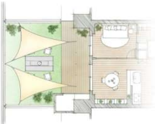
「半ソト空間」イメージ図