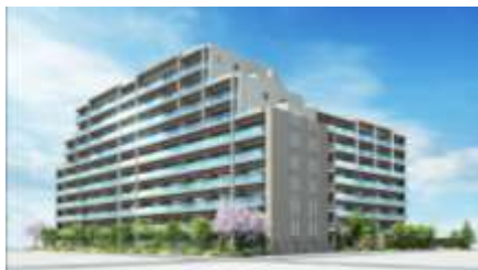
「パークホームズ赤羽西」外観 (完成予想 CG)