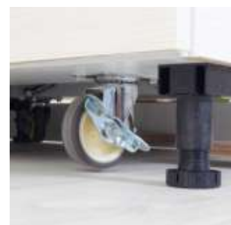
キッチン下部キャスター