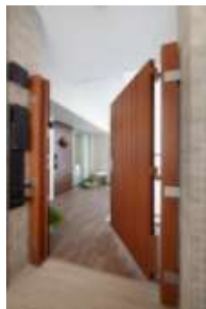
施錠可能なポーチ扉