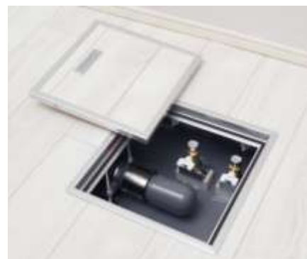
キッチン接続ポート