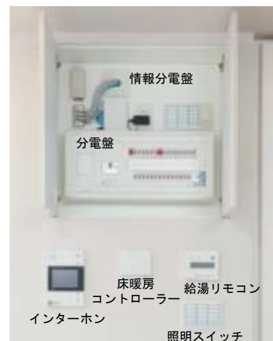
集約した設備スイッチ

カラーモニター付インターホンをはじめ、床暖房コントローラーや給湯リモコン等をコアゾーンの壁面に集約することでスイッチ類に左右されない自由な空間レイアウトを実現しました。さらに、照明のON/OFFを1カ所で操作できるため、外出時の消灯等にも便利です。