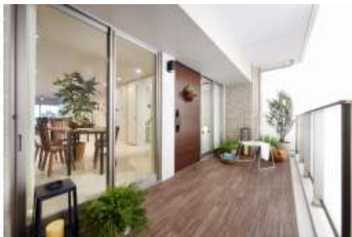
バルコニー感覚が味わえるウェルカムポーチ

玄関側の開口部に出入可能な掃き出しサッシを採用し、約 11 m 2 のウェルカムポーチを設けました。このことにより玄関側にリビングダイニングを配置した場合も、開放感と明るさを感じられる空間が実現しました。またセキュリティに配慮した施錠可能な高さ約 1.8m のポーチ扉のおかげで、ウェルカムポーチのプライバシー性が確保され、玄関前をバルコニーのように使用できるようになりました。まるで部屋の両面にバルコニーがあるように、ウェルカムポーチから、より自由な発想の暮らしのデザインができます。