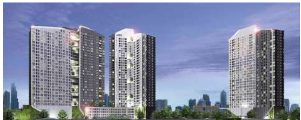
左：Q Chidlom-Petchaburi 上：Ideo 0 2 （右からA棟、B棟、C棟）