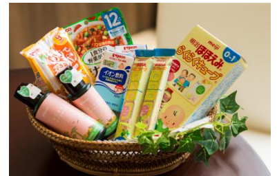
上：キッズチェア使用時の様子 下：お試し品例