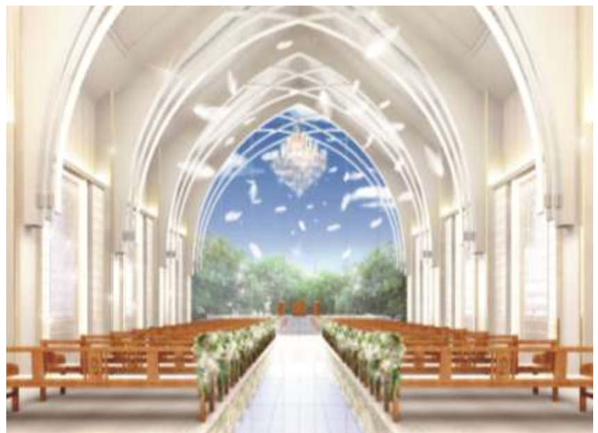
▲チャペルイメージ