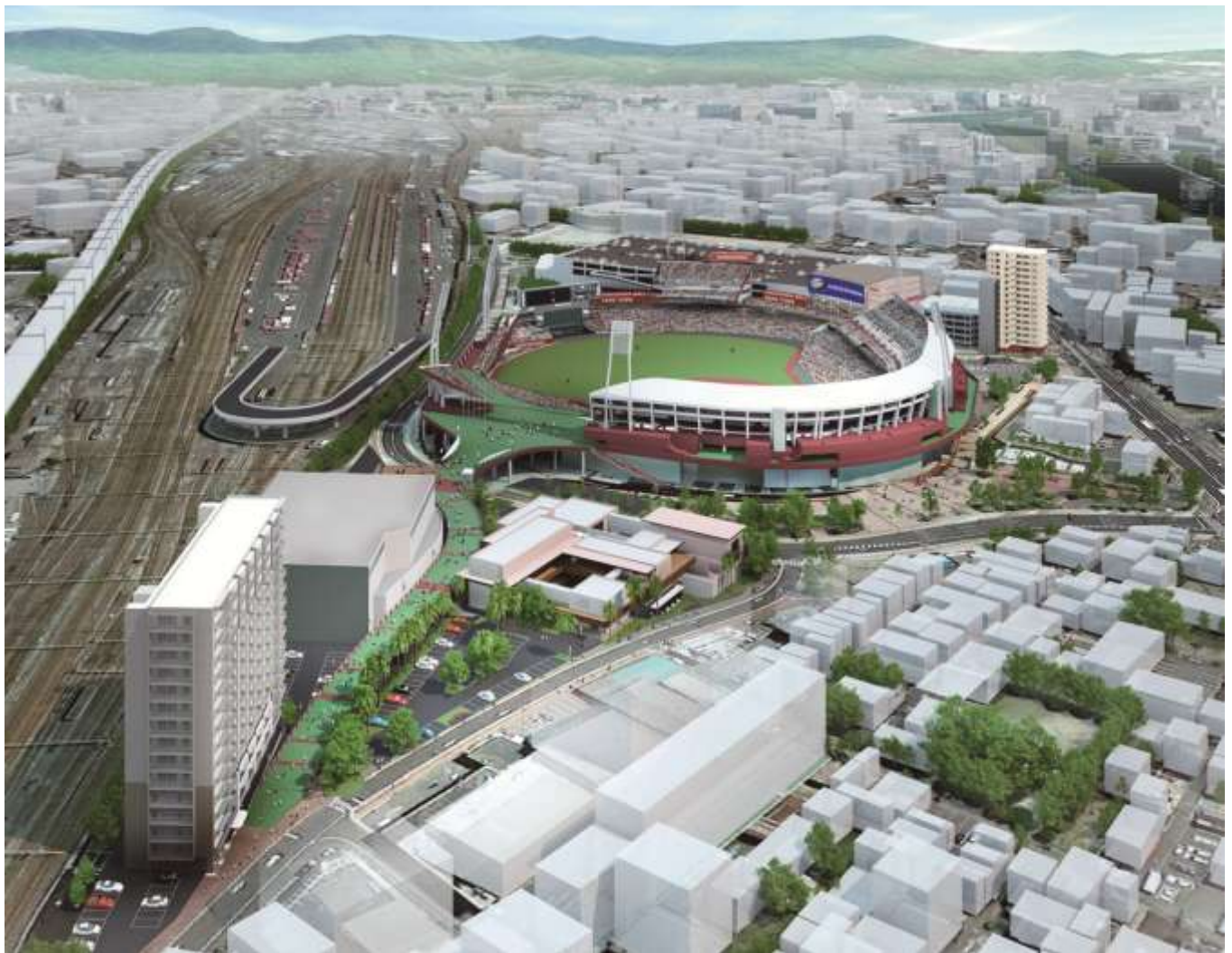
▲「広島ボールパークタウン」完成予想図

2015年2月25日 広島東洋カープ屋内練習場 竣工 2015年3月7日 ララシヤンスHIROSHIMA 迎賓館 グランドオープン 2015年3月中旬 パークホームズ広島ボールパークレジデンス 第1期販売開始