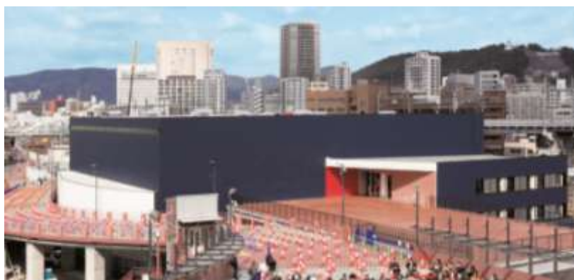
▲「カープ屋内練習場」

事業主：株式会社広島東洋カープ 敷地面積：約6,230㎡ 施設概要：45m×45mの練習場・ブルペン4ヶ所他 竣工日：2015年2月25日