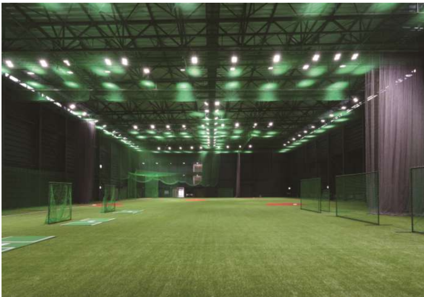
▲「カープ屋内練習場」

プロ野球が開催されない日にも「躍動感」を創出する広島ボールパークタウンの魅力づくりと、練習環境の充実のため、マツダスタジアムに隣接した屋内練習場を新設致しました。1年を通じて、主に1軍の屋内練習場として利用します。マツダスタジアムプロムナード(西蟹屋プロムナード)と接続するオープンデッキや、施設内が見学できるギャラリースペースを設けており、広島ボールパークタウンの魅力とにぎわいが増します。また、野球の振興や普及のために、野球教室等も開催予定です。