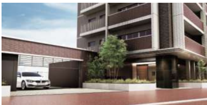
▲セキュリティゲート・エントランス完成予想CG