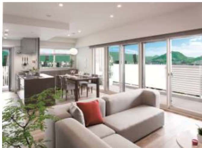
▲モデルルーム室内写真