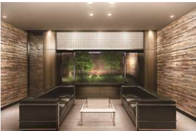
▲オーナースラウンジ完成予想CG