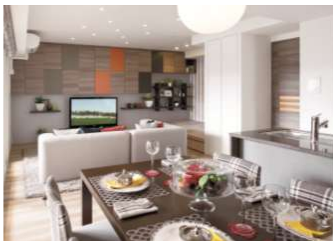
▲モデルルーム室内写真