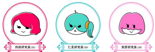
【モチエ女子 主任研究員】 【賃貸一人暮らし 研究員】 【実家暮らし 研究員】