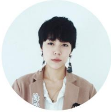
MOMOKO ANDO 安藤桃子

1982年生まれ。高校時代よりイギリスに留学。その後ニューヨークで映画作りを学ぶ。2010年4月、監督・脚本を務めたデビュー作『カケラ』が、ロンドンのICA（インスティテュート・オブ・コンテンポラリー・アート）と東京で同時公開され、国内外で高い評価を得る。2011年に幻冬舎から初の書き下ろし長編小説『0.5ミリ』を刊行。同作を自ら監督した映画『0.5ミリ』が2014年11月、「有楽町スバル座」ほか全国順次公開。