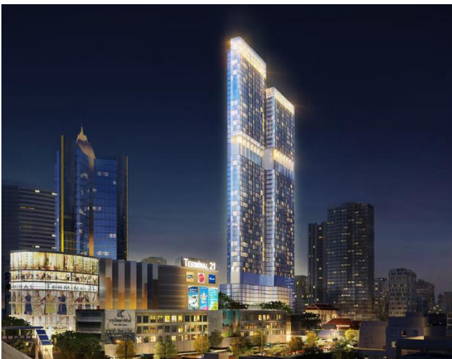
「アシュトン・アソーク」完成予想パース