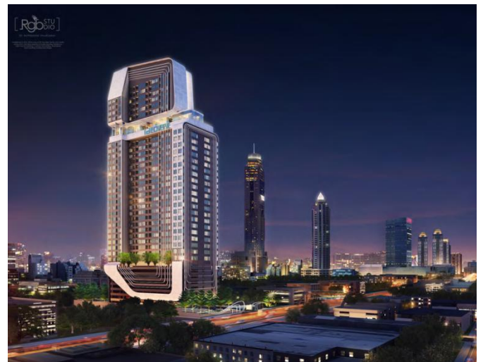
「イデオQサイアム・ラチャテウィ」完成予想パース