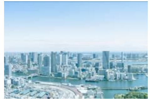
目覚ましい発展を遂げる「東京湾岸エリア」

また、同エリアは、再開発エリアとして、近年目覚ましい発展を遂げています。2000年の大江戸線開通、2006年の晴海大橋の完成、そして2015年度の環状2号線の開通など交通網の整備が予定されています。住環境においても高層マンションが次々に建設されています。さらに、日本中が注目している2020年東京オリンピック・パラリンピックでは、晴海エリアが選手村建設予定地となるなど、今後の更なる発展が期待されています。