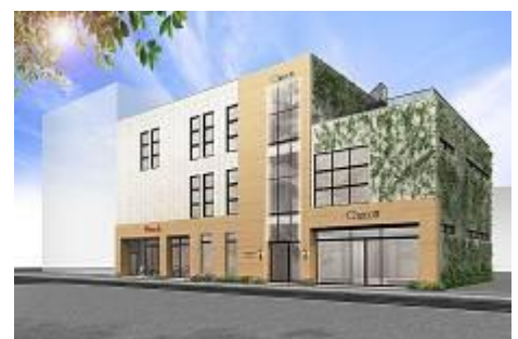
「(仮称)チャコット勝どきスタジオ&カフェ」イメージ

当社が施設パートナーとして支援する、バレエの美しさと健やかなライフスタイルをまるごと体感できる新しいバレエ複合施設(仮称)チャコット勝どきスタジオ&カフェは2014年11月勝どきにオープン予定です。本施設では、「バレリーナのヨガ」とも言われている「ジャイロキネシス®」エクササイズ専用ルームの開設や「バレエ・フード」をテーマにしたダイニングカフェも併設し、気軽にバレエのパフォーマンスを見ることが出来ます。