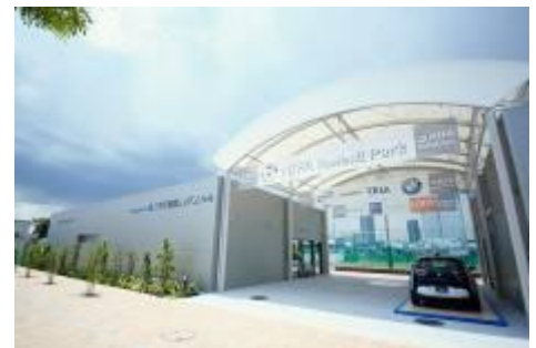
「MIFA Football Park」

桜井和寿とGAKU-MCのユニット「ウカスカジー」が所属する団体「MIFA」が2014年6月にオープンしたMIFA Football Parkは、音楽とフットボールによるコミュニケーションの創造をコンセプトとした新しいフットボールパークとなっており、当社は施設パートナーとして支援しています。施設内には、フットサルコート3面としても利用可能なジュニアサイズのサッカーコート1面とカフェを完備しています。また、サッカー日本代表の本田圭佑選手がプロデュースするサッカースクール「SOLTILO FAMILIA SOCCER SCHOOL 新豊洲校」が開校している他、音楽ライブなど音楽とフットボールを通じたコミュニケーションの場を提供します。