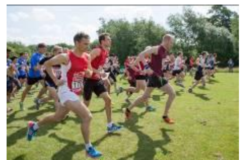
「ザ・コーポレートゲームズ 東京 2014」イメージ

当社が主催するザ・コーポレートゲームズ 東京 2014は、2014年9月25日から28日の期間に、湾岸エリアのスポーツ関連施設において、リレーマラソンや野球、テニス、ゴルフなど全13競技を行うマルチスポーツフェスティバルです。これまで世界30カ国60都市で開催され、延べ100万人以上が参加しています。日本での開催は今回が初めてとなります。なお、年齢・性別・国籍・人種・宗教などの制限なく、どなたでも参加できます。