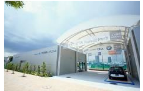
「MIFA Football Park」