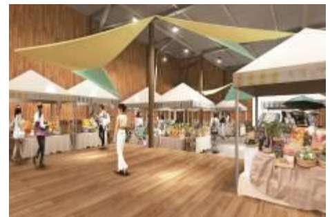
「FOODARTS STUDIO KACHIDOKI」イメージ

2014年5月、当社が協力している「食とアート」の融合をコンセプトとした複合型施設FOODARTS STUDIO KACHIDOKIがオープンしました。本施設は、勝どきの倉庫を活用し、太陽のマルシェ常設スペースの設置や絶品グルメが味わえるキッチンカーの出店、オーガニック・ナチュラル商品の展示をしています。その他、親子で楽しめるアート体験やヨガ・ダンススクールなど地元の方が参加し、楽しめるカルチャープログラムを多数ご用意しています。