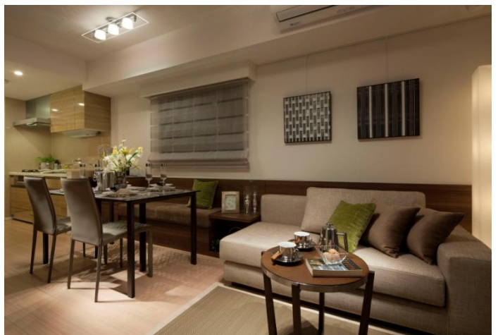
<モデルルーム 写真>