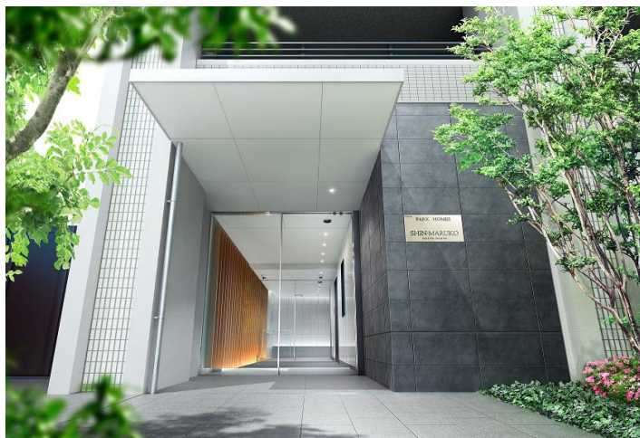
〈パークホームズ新丸子ステーションプレミア 外観完成予想 CG〉