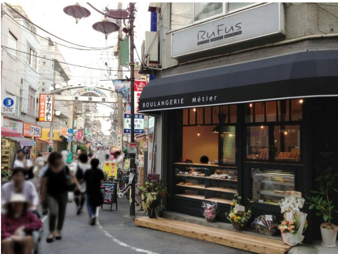
<新丸子東栄会商店街>