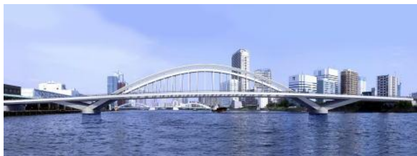
〈隅田川橋りょう (仮称) 完成予想図〉