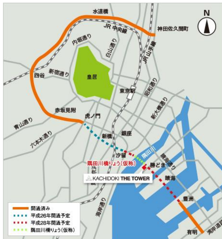
〈環状第 2 号線全体図〉