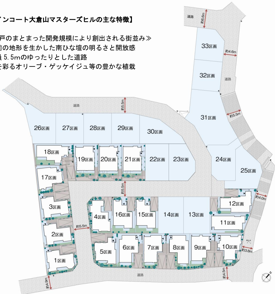
ファインコート大倉山マスターズヒル 配棟計画