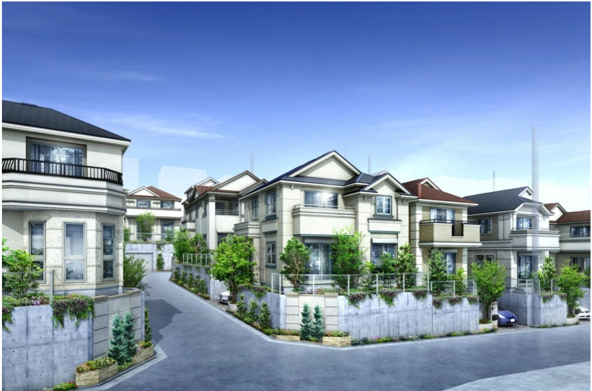
ファインコート大倉山マスターズヒル イメージパース