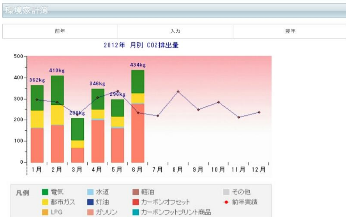
すまいのECOチャレンジ画面 イメージ