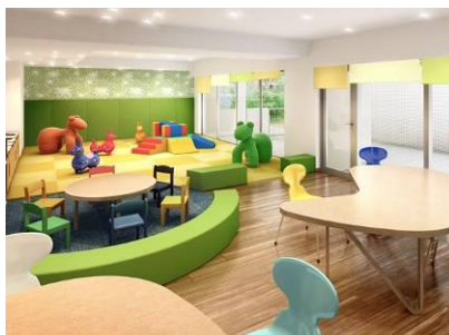
「親子カフェ」完成予想図 子供を見守りながらティータイムが愉しめるキッズコーナーとカフェコーナーをひとつにした空間。