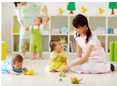
認可保育施設(※写真はイメージです) 0歳児～5歳児まで預けられる100名規模の認可保育施設。