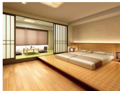
ゲストルーム「ジャパニーズスイート」 完成予想図