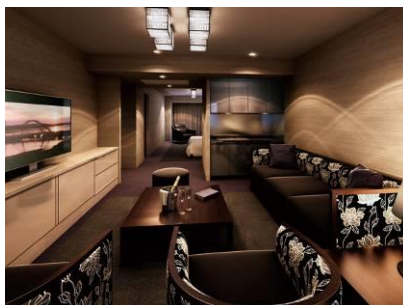
ゲストルーム「ラグジュアリースイート」 完成予想図