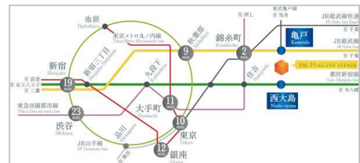
都心主要スポットへのアクセス

本物件は、JR総武線「亀戸」駅まで徒歩6分、都営新宿線「西大島」駅まで徒歩5分と駅近物件であり、東京駅まで10分(亀戸駅より)、銀座駅まで12分(亀戸駅より)、新宿まで19分(西大島駅より)と都心の主要スポットへのアクセスが良好です。通勤時間を短縮することで、家族の時間を創出できる立地となっています。