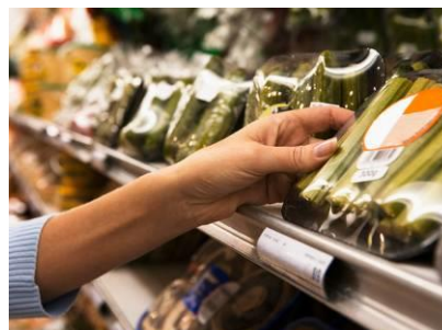
ミニショップ(※写真はイメージです) 育児用品に加え、調味料やティッシュペーパーなど身近に必要なものを取り揃えた深夜まで営業するミニショップ。