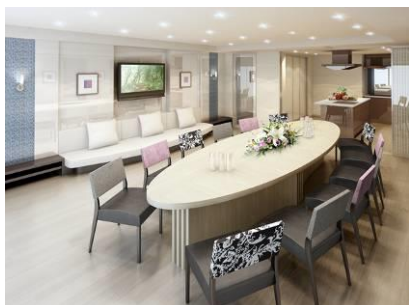
「パーティールーム」完成予想図