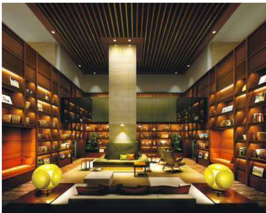
メインライブラリー

〇8つのライブラリーと「青山ブックセンター」との提携 ブックコンサルタントがセレクトした書籍コーナーのある「メインライブラリー」やご入居者の 不用となった書籍等を活用した「リサイクルライブラリー」など趣の異なる8つのライブラリー