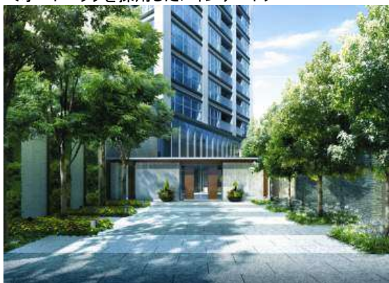
<オートロックを採用したメインゲート>