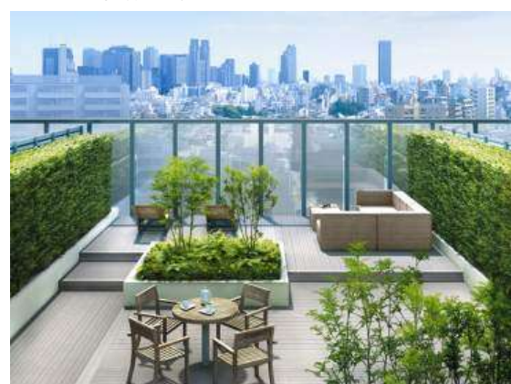
<屋上の開放感あふれるスカイテラス>