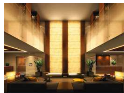
ラウンジライブラリー