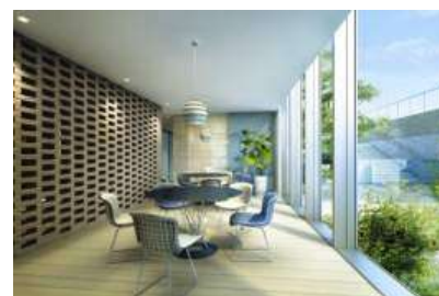
コミュニケーションライブラリー