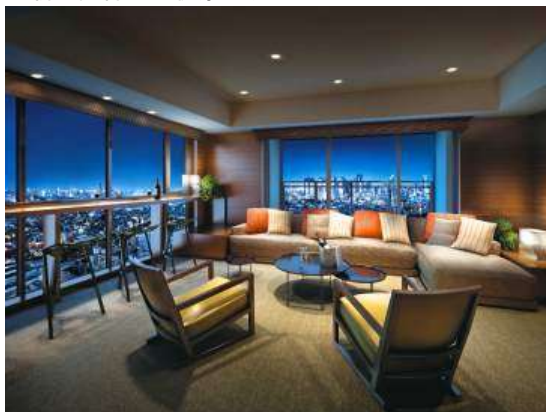
<新宿副都心の夜景や眺望が楽しめるスカイラウンジ>