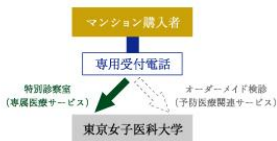
専属医療サービスの流れ

上記1、2を総合的に予防・診療を組み合わせたサービスを提供することで、お客様の健康で豊かな「暮らし」をサポートしていく予定です。