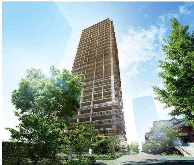
パークタワー西新宿エムズポート(外観完成予想 CG)

※「特別診察室」は、主任教授等の診察経験豊富な医師による診察・健康相談を行なうため開設された特別な診察室です(有料)。