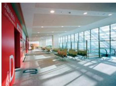
総合外来センター