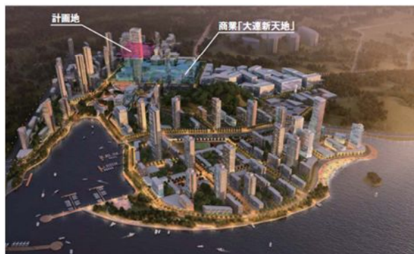
サイト A（完成予想パース）