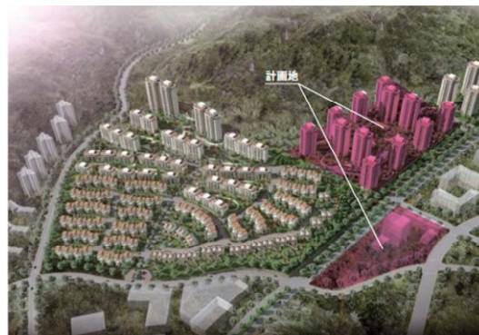
サイト C（完成予想パース）