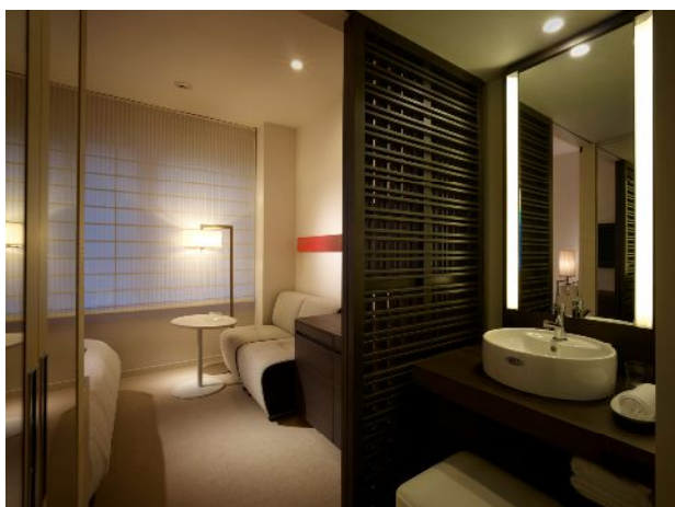
客室（コンフォートダブル）