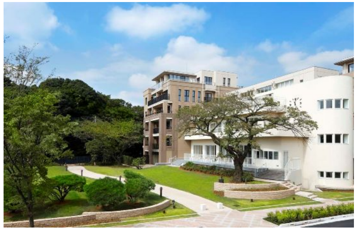
外観（E棟・クラブハウス）