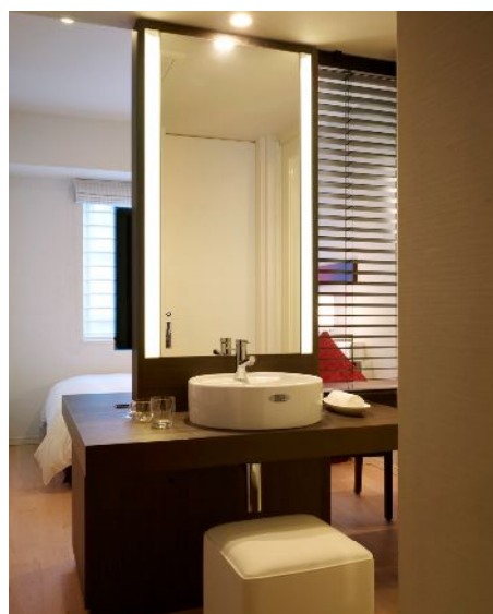
客室（コンフォートシングル）