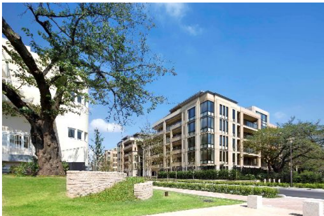
パークシティ浜田山