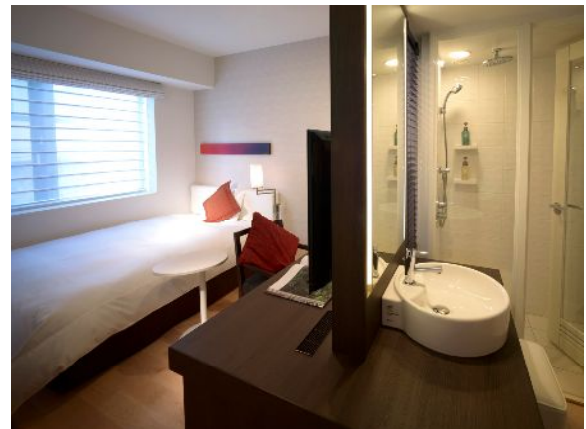
三井ガーデンホテル四谷