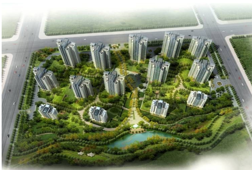
区画 12a 完成予想パース

■「区画 12a（第1期 本年5月末着工予定）」では、天津市内の一次取得者層をメインターゲットに、3LDK（全て内装付き）を中心とした中高層住宅を今秋販売予定です。