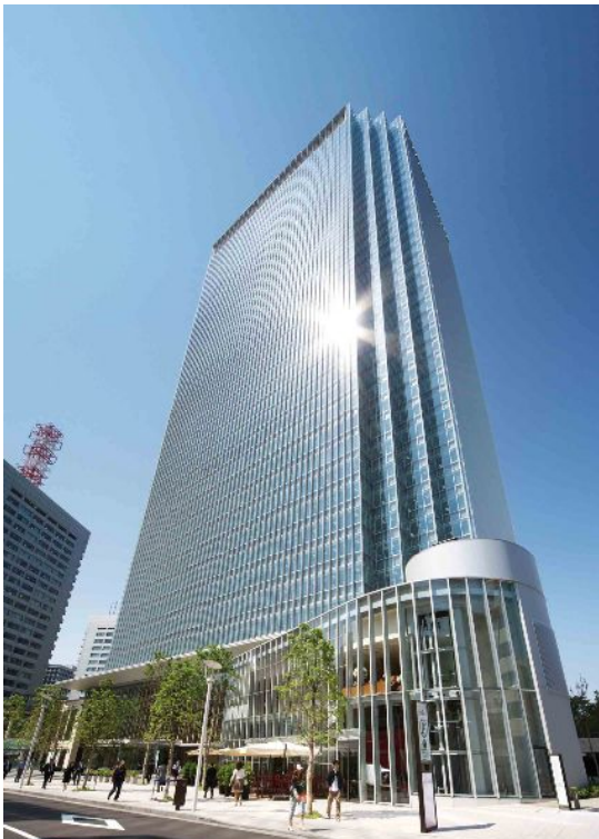
赤坂 Biz タワー