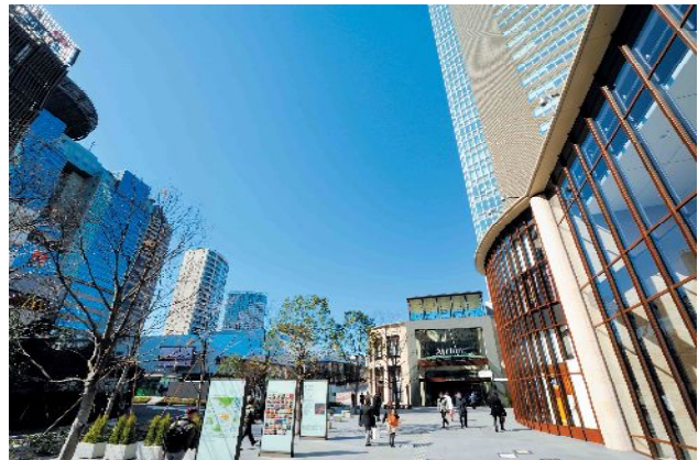
赤坂 Biz タワー SHOPS&DINING