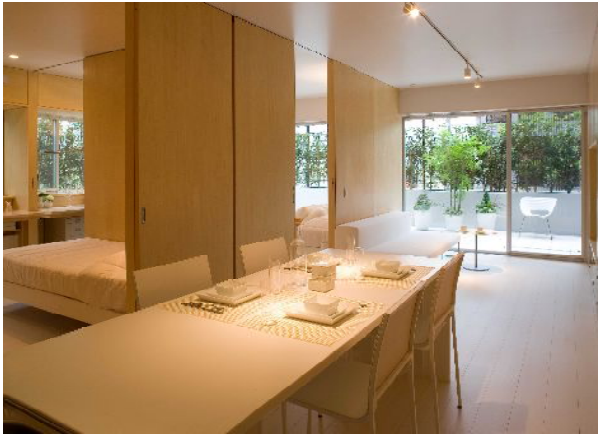
キッチンよりリビング方向を望む