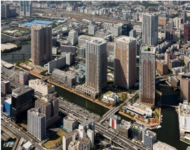
芝浦アイランド空撮

事業者：有限会社芝浦チャンネル開発 （三井不動産株式会社、大和ハウス工業株式会社、 株式会社ケン・コーポレーション、株式会社新日鉄都市開発、 オリックス不動産株式会社） 所在地：東京都港区芝浦四丁目 20-4 交通：JR 山手線・京浜東北線「田町」駅歩 11 分、 都営地下鉄三田線・浅草線「三田」駅歩 13 分他 敷地面積：4,542.25 m 2 (1,374.03 坪) 構造規模：鉄筋コンクリート造（一部鉄骨造）地上 9 階 延床面積：14,794.78 m 2 (4,475.42 坪) 設計・監理：株式会社日建設計 インテリアデザイン：株式会社 TEAM IWAKIRI JAPAN ランドスケープデザイン：株式会社ランドスケープデザイン 施工：大和ハウス工業株式会社 スケジュール：着工 平成 19 年 6 月 竣工 平成 21 年 9 月