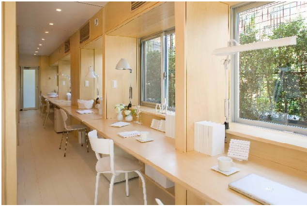
パークホームズ成増マークレジデンス 第5回三井住空間デザインコンペ最優秀作品