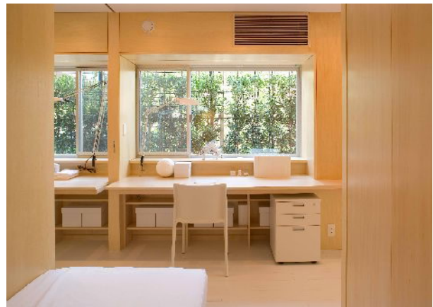
洋室から「机ギャラリー」をみる