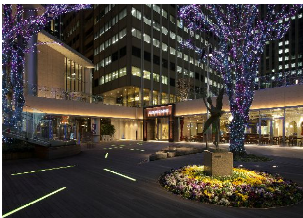
ライトアップしたけやき広場