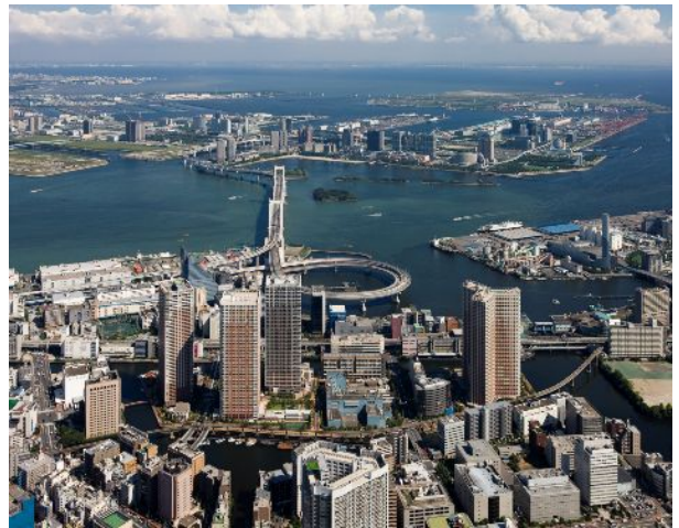
芝浦アイランド空撮