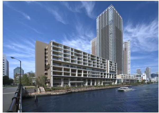
芝浦アイランド ブルームホームズ