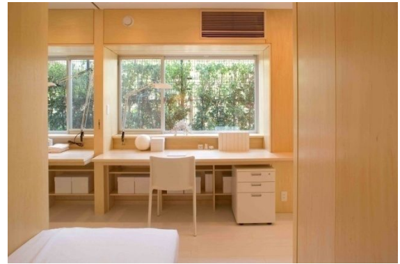
洋室から「机ギャラリー」をみる