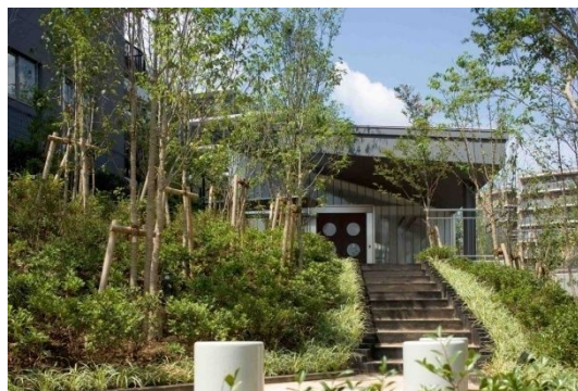
集会室<フォレストスクエア>