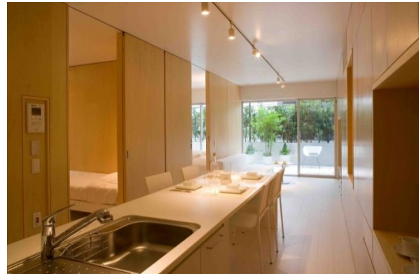
キッチンよりリビング方向を望む