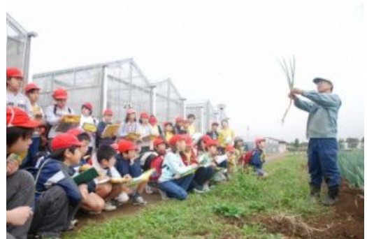
ピノキオメディアセンター(千葉大学取材)