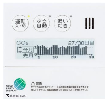
セーブアースディスプレイ 表示イメージ