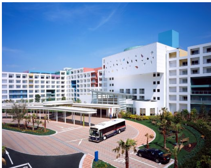
三井ガーデンホテル プラナ東京ベイ

つくばエクスプレス「柏の葉キャンパス」において開催の子供を主役とした街づくりイベント。キッズデザイン 2008 金賞【経済産業大臣賞】共創デザイン賞も受賞。