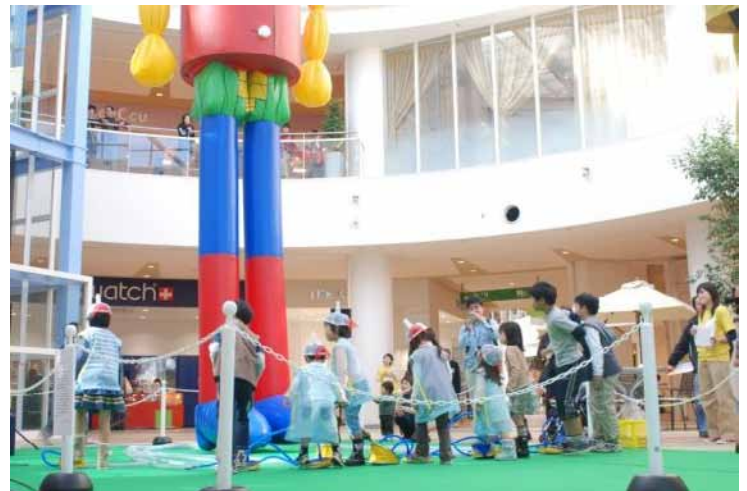
ピノキオプロジェクト

■当社グループは、今後も「都市に豊かさや潤いを」というグループステートメントのもと、各プロジェクトへの取り組みを通じて、魅力ある街づくりや住まいづくりを行い、社会の発展と豊かな暮らしの実現を目指してまいります。