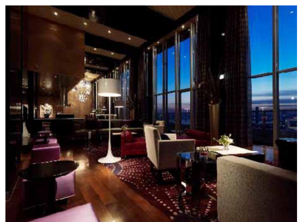
スカイラウンジ（タワーB）