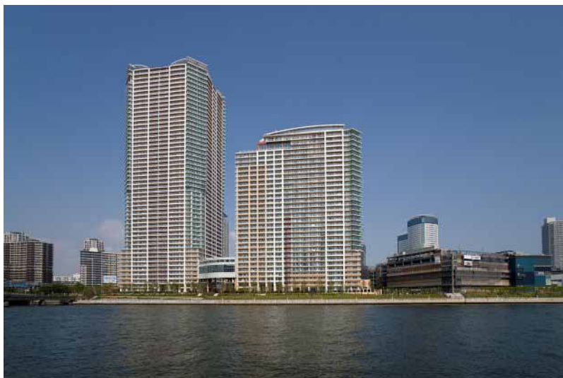
アーバンドック パークシティ豊洲