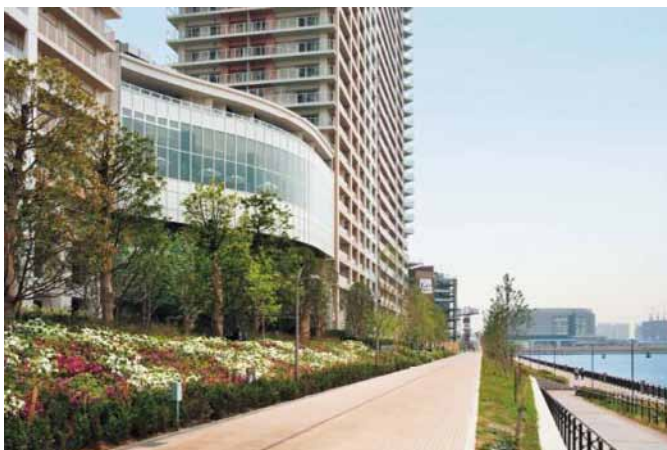
ららぽーと豊洲と一体的に開発した外構（東京湾側）