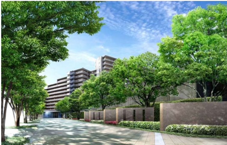
グランドアプローチ