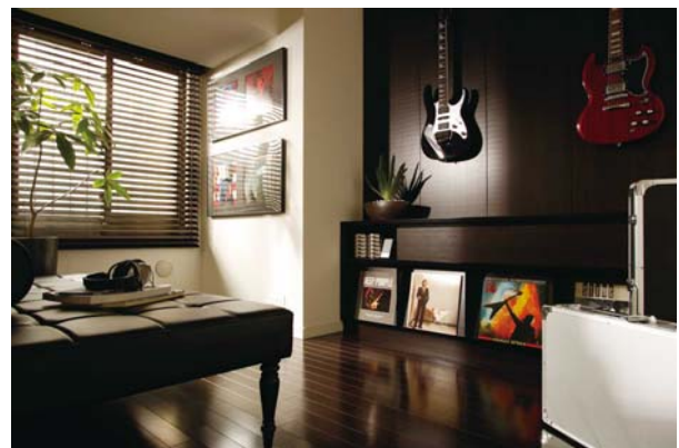
ホビーミュージアム&ゲストルーム