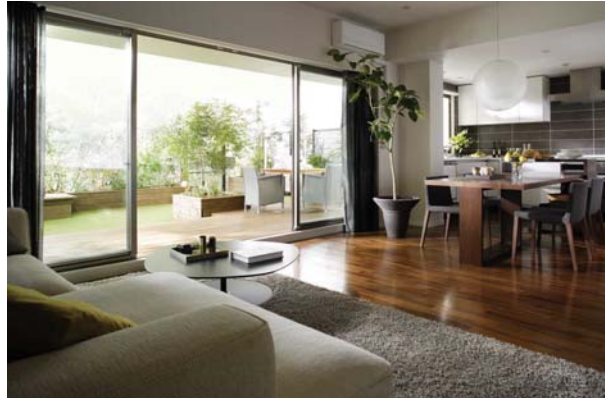
リビング・ダイニング・キッチン