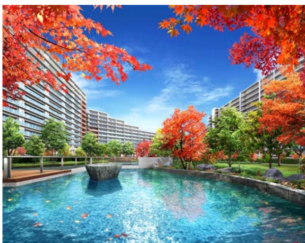
中庭“セントラルガーデン”完成予想パース