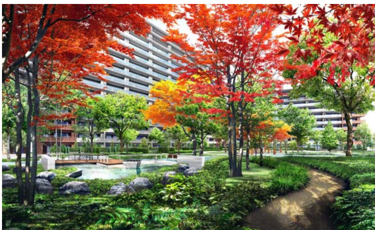
セントラルガーデン