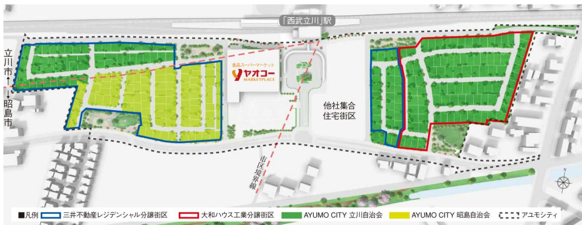
《アユモシティ全体図》

戸建街区の事業主である三井不動産レジデンシャルと大和ハウス工業は、「アユモシティ」に住まう住民間のコミュニティ形成・促進を支援すべく、「アユモシティ」において、『①行政ごとに昭島市と立川市の自治会を新しく設立すること』、『②行政の違いや戸建・集合住宅といった住居形態の違いを越えて、「アユモシティ」というひとつの街として一体となった住民活動組織を設立すること』を提案し、昭島市・立川市と協議を重ねてまいりました。この住民活動組織の枠組みをもとに、「AYUMO CITY 昭島自治会」「AYUMO CITY 立川自治会」が設立され、同時に両自治会は「AYUMO CITY 連絡会」を設立いたしました。