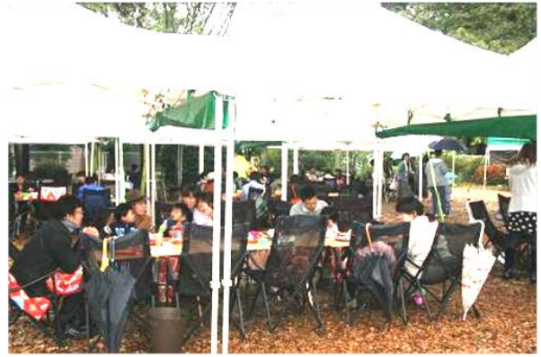
《両自治会合同懇親会の様子》