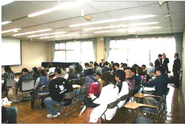
《自治会設立総会の様子》